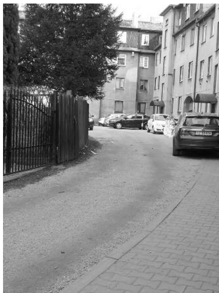
W Zabrze przy ul. Krasińskiego 22-34 i Kobylińskiego 2-10, na zapleczu zasobów mieszkaniowych GSM „Luiza”, została utwardzona nawierzchnia gruntowa