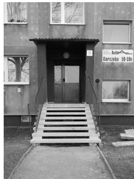
W Zabrze przy ul. Korczoka 57-57d i 59-59e, został wykonany remont schodów wejściowych do ww. budynków