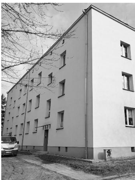
W budynku przy ul. Chroboka 1-3 w Rudzie Śląskiej zakończono prace termomodernizacyjne i instalacyjne w zakresie wod-kan. i centralnego ogrzewania