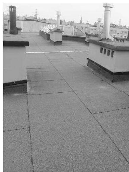
Niedawno został wyremontowany dach budynku GSM „Luiza” w Zabrze, przy ul. Olchowej 13-13A