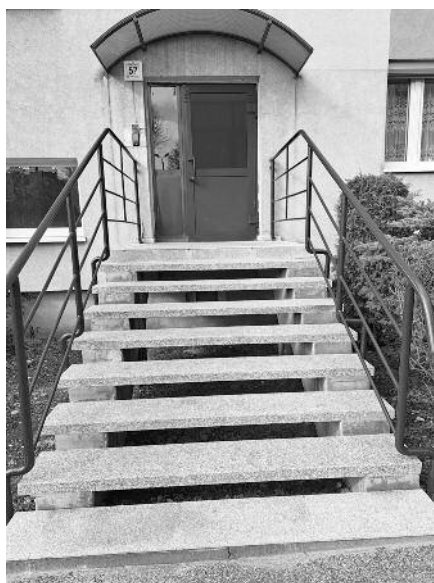
W budynku przy ul. Ks. Niedzieli 57 w Rudzie Śląskiej zostały zmodernizowane schody wejściowe do klatki schodowej