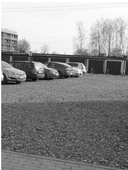
W Zabrze przy ul. Korczoka 57-57d i 59-59e, na zapleczu zasobów mieszkaniowych GSM „Luiza” została utwardzona nawierzchnia dużego parkingu

Tych kilka prostych wskazówek z pewnością pozwoli uniknąć stresu, a nawet przyspieszyć usunięcie przykrew awarii. Wszak dziś niemal wszystko jest na prąd.