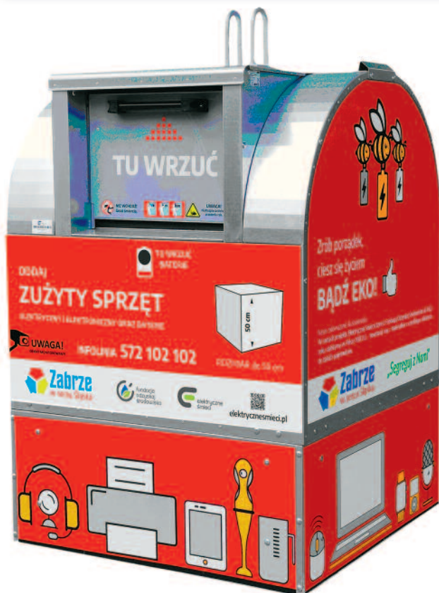
Lista lokalizacji pojemników na zużyty sprzęt elektryczny i elektroniczny oraz baterie na terenie miasta Zabrze