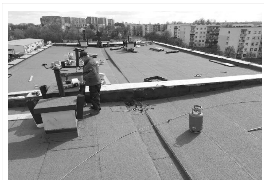
Remont kapitalny dachu budynku GSM „Luiza” w Zabrzu, przy ul. Korczoka 74-74a

3. W odpowiedzi na wniosek w sprawie podłączenia nieruchomości znajdującej się w Zabrzu przy ulicy Goethego 14-16A do miejskiej sieci ciepłowniczej wraz z wykonaniem kompleksowej termomodernizacji, GSM „Luiza” informuje że: po analizie przeprowadzonej ankiety wśród mieszkańców ww. nieruchomości, z uwagi na brak zgody na likwidację już istniejących źródeł ogrzewania (w tym indywidualnych ogrzewań gazowych wszystkich właścicieli mieszkań) nie możemy zgłosić gotowości podłączenia ww. nieruchomości do miejskiej sieci ciepłowniczej.