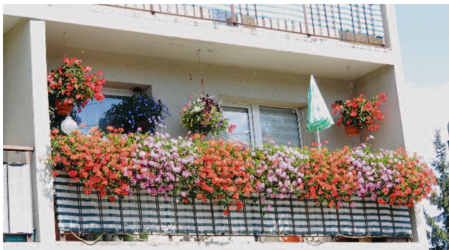
Lauerat konkursu z roku 2016 w kategorii balkony, ul. Agrestowa 5