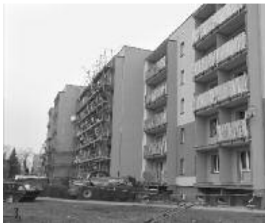
Dobiegają prace przy termomodernizacji budynku przy ul. Bielszowickiej 95 w Rudzie Śląskiej

Kopia cytowanego pisma jest dostępna w Dziale Technicznym Rejon II przy ul. Bielszowickiej 98.