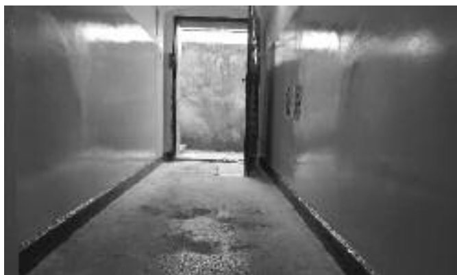
Poprawione malowanie ścian korytarza w budynku przy ul. Gen. de Gaulle'a 30a w Zabrze.

Odp. Poprawiono malowanie korytarza jw. prowadzącego na tyły ww. budynku. Wymiana drzwi będzie możliwa po zgromadzeniu odpowiednich środków finansowych na koncie funduszu remontowego ww. nieruchomości.