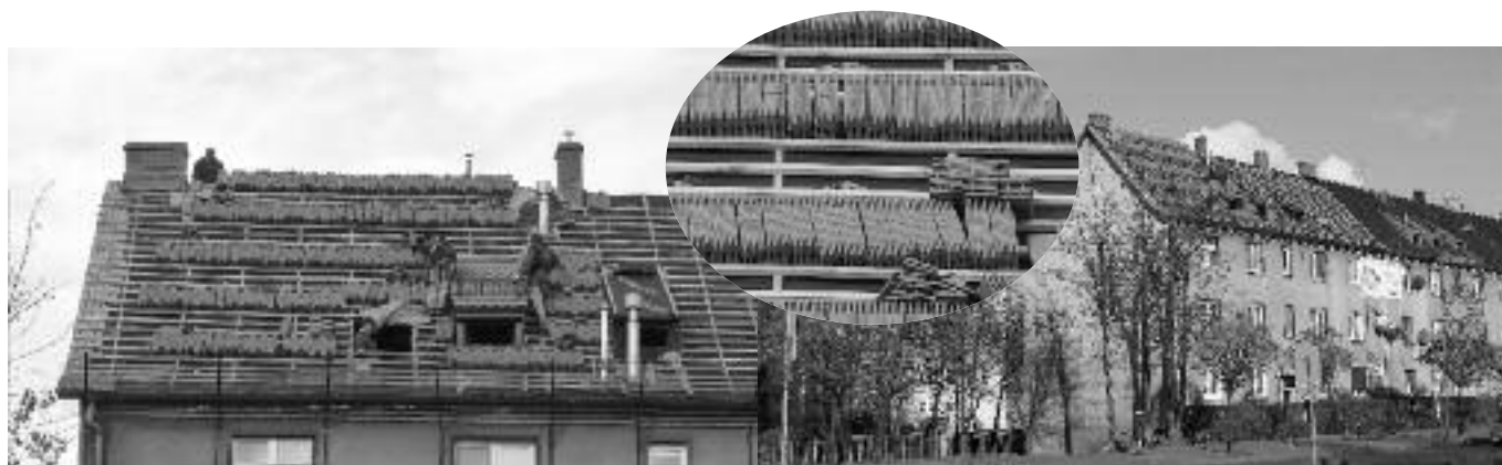
Remont dachu w nieruchomości GSM "Luiza" przy ul. Goethego w Zabrze.

ul. Leszczynowa 9/1 – 1) w związku ze zbliżającym się końcem robót ziemnych przy modernizacji budynków