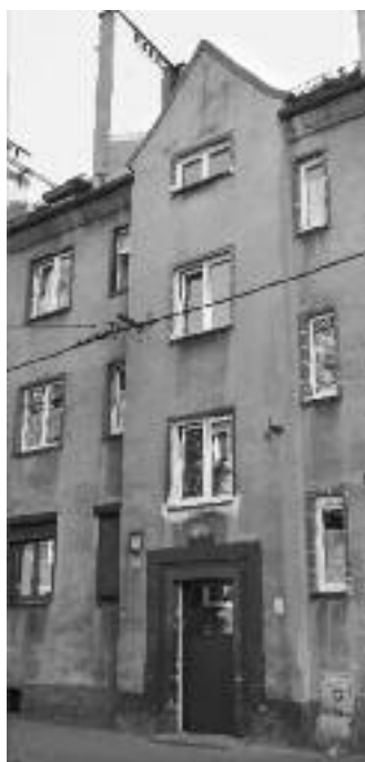
Wymienione drzwi i okna w budynku GSM „Luiza” przy ul. Szymanowskiego, w Zabrzu.

ul. 1-go Maja 26/5 – Proszę o wyremontowanie i utwardzenie nawierzchni między budynkami, gdyż dojazd jest utrudniony z powodu dziur a zimą i jesienią jest mokro i brudno.